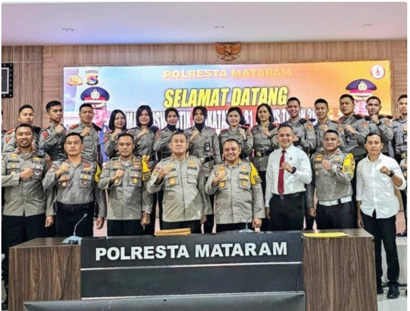
Kapolresta Mataram dan segenap PJU bersama Mahasiswa STIK / PTIK pada acara Penyambutan di Gedung Wira Pratama Polresta Mataram, (17/03/2024)

Mataram NTB - Sebanyak 24 Siswa Sekolah Tinggi Ilmu Kepolisian (STIK) / Perguruan Tinggi Ilmu Kepolisian (PTIK) Lemdiklat Polri Angkatan 81 hadir di wilayah hukum Polresta Mataram dalam rangka pelaksanaan tugas pendidikan