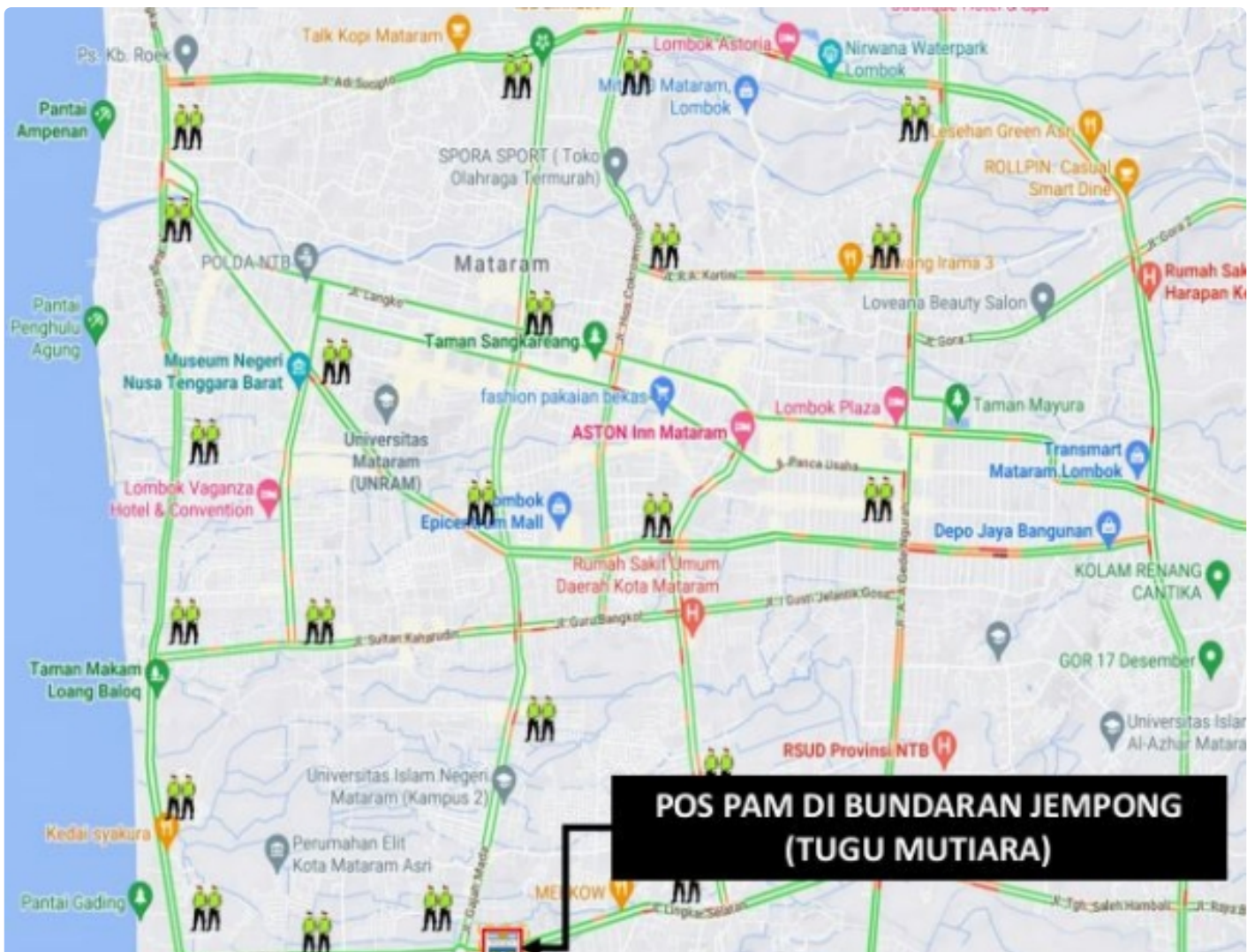
Personel yang Disiagakan pada Pos Pengamanan dan Pos Penyekatan, (04/11)

Mataram NTB - Mendukung terselenggaranya event Internasional Word Superbike (WSBK) Mandalika 2022 berlangsung sukses, ribuan personel akan disiagakan di dalam wilayah pulau Lombok, untuk itu para penonton tidak perlu